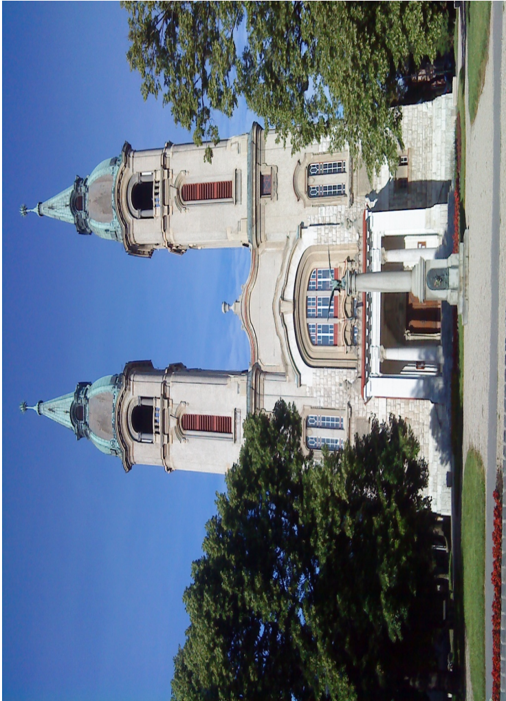
Reformovaný kostel před školou

Popisky k následujícím fotkám (shora dolů)