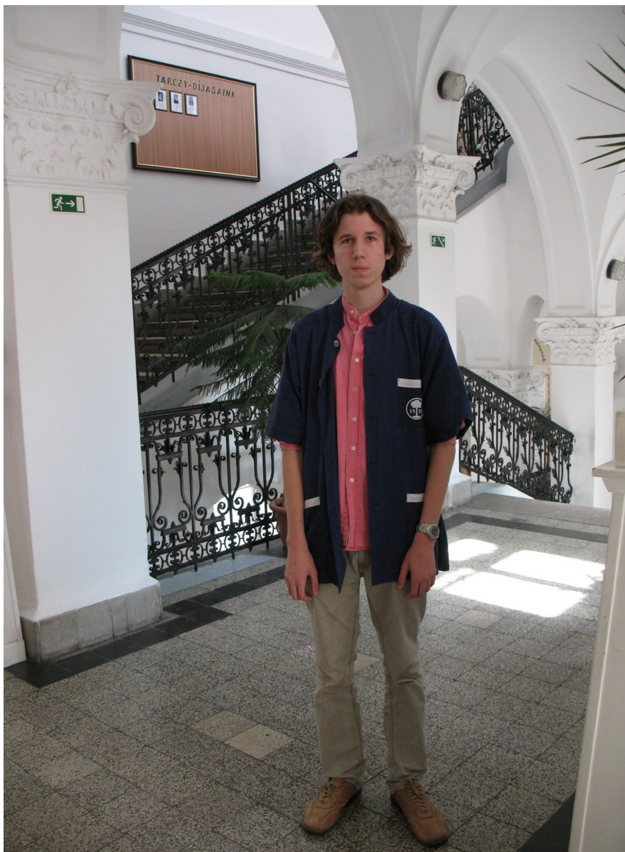
Hlavní schodiště – 1. Poschodí. Je zde možno vidět onen krásný köpeny (mě se líbí)