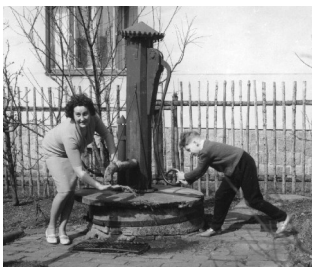
Obr. 1: Pamětník 1 se svojí matkou u tehdejšího zdroje vody

Dříve bylo složitější praní prádla a takové praní často zabralo celý den. Prádlo bylo shromážděno během tří neděl. Oblečení se nosilo déle než dnes.