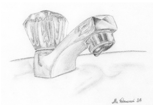
Obr. 2: Dnešní zdroj vody (kresba Allia Federmanová)

Dříve lidé s elektřinou velmi šetřili a to kvůli její ceně. Proto, když už někde byla zavedena, byla využívána jen na nejnnutnější věci, převážně na svícení. Dnes je elektřina v každé domácnosti. Na elektřině vaříme, někdy se s ní i topí, svítíme s ní a využíváme ji mnoha dalšími způsoby, pračky, kuchyňské spotřebiče, myčky, sporáky, trouby, po-