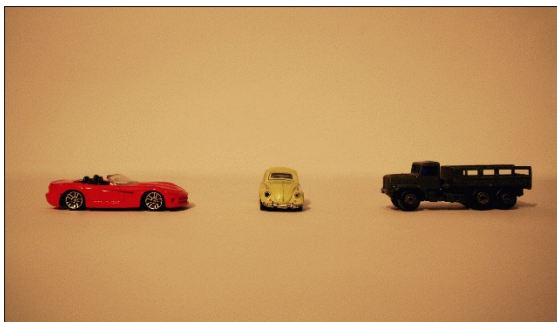
Obr. 8: Modely aut VW Beatle, Doge Viper STR-10 a armádní nákladák Pumper