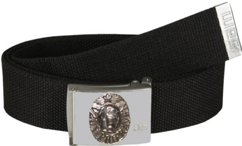
Obr. 5: Jak bychom vypadali pod komunistickým režimem dnes (fotomontáž Jan Prokeš)

Když jsem byla malá, tak jsem většinou dědila oblečení po sestře, ale občas jsem dostala nějaký svetr nebo kamaše. Většinu věcí šila moje maminka, takže moje vzpomínka na dětství je, jak si u šicího stroje zkouším oblečení.