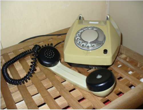
Obr. 10: Bakelitový telefon — je vidět, že se pro zapojení používala jiná vidlice než dnes