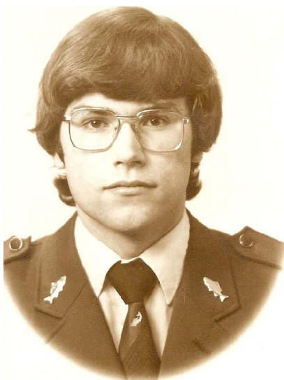
Obr. 37: Pamětník 3, maturitní foto ze Střední rybářské školy ve Vodňanech

Nejspíš ne. V boha nejspíš nevěřím, ale jsem ochotný věřit v anděla strážného.