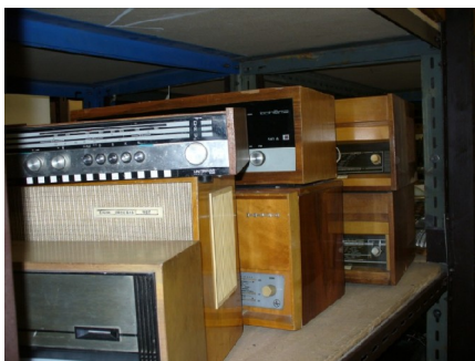
Obr. 20: Různé rozhlasové přijímače ze skladu fundusu ČT