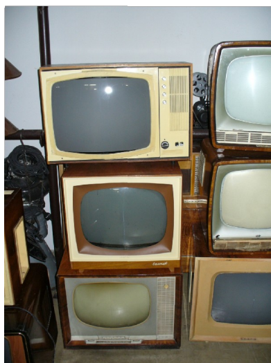
Obr. 17: Další televizory z 60. let ze skladu fundusu České televize