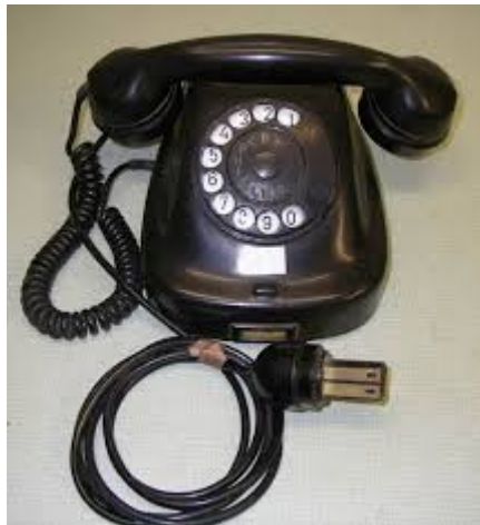
Obr. 13: Telefonní přístroj ze skladu fondusu České televize