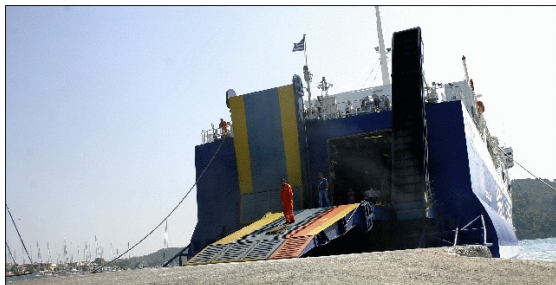
Obr. 9: Dopravní trajekt na ostrově Skopelos

kni, skoro až na zem. Vždycky si vezla v těch kapsách mentolový bonbony a já jsem jí vždycky říkala „Babi nemáš ten prdlavej bonbon“.