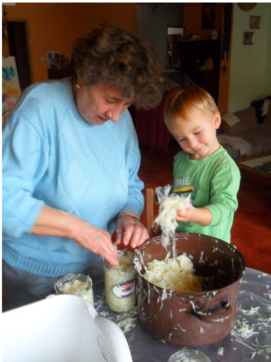
Obr. 31: Tuto fotografii jsem pořídila, když jsem zpovídala babičku. Jak můžete vidět, nelze ji zachytit, aby něco nedělala.

Do práce jsem šla v 16 letech. Já jsem chodila 8 let do školy a šla jsem tehdy na hospodářskou školu, což je dnešní ekonomka. To bylo na dva roky, tím pádem jsem v šestnácti vychodila školu a šla do práce. Celý život jsem dělala administrativní práci. Já jsem byla v OSP, tam jsem dělala účetní. Pak jsem přešla do fabriky, kde se vyráběly boty, tam jsem dělala rok účetní a potom, když mistr na provoz odešel do důchodu, tak jsem šla dělat mistrovou. Potom tam výroba skončila, to jsem