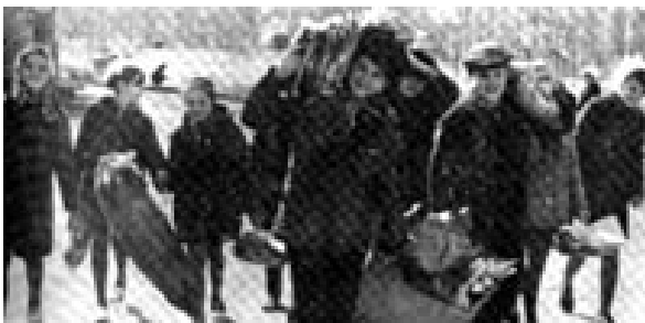
Obr. 33: Děti jdou ze školy. 50. léta.

Kdybych to měla teda porovnávat s dneškem, tak tehdy byly sladkosti opravdu mnohem chutnější a lepší, ale opravdu nevím, čím to je. Možná tím, že to bylo více přírodní, domácí... Všechno nevypadalo možná tak dobře jako dnes, ale zato to bylo mnohem zdravější a chutnější. Samozřejmě dnes je také hodně vynikajících věcí, ale prostě tu chuť, kterou jsem zažila tehdy, už nikdy nezažiji, protože už je všechno jiné.