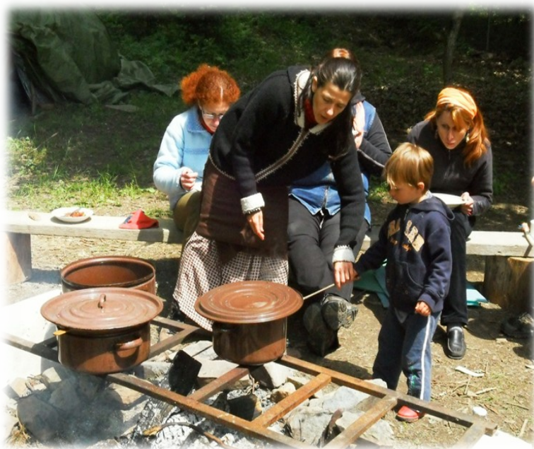
Obr. 30: Jak dokazuje tato fotka, i v dnešní době stojí ženy u plotny (ohně) a starají se o děti. Tuto fotku jsem fotila v létě, když maminka vařila na kurzu výroby šamanských bubnů u nás v Těšíkově.

Ve dvaceti jsme se brali a letos už jsme spolu 48 let. Dneska když má někdo pětadvacet, tak je to brzo a tehdy to už bylo pozdě. Já jsem si říkala, že asi budu velmi brzy babičkou, ale tím, že jsme měli ty dva kluky, tak se to zas až tak nepovedlo.