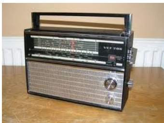
Obr. 23: Jeden z „tranzistoráků“, VEF 206, Sovětský svaz, rok výroby 1974