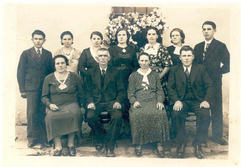
Obr. 29: Rodinné foto. V zadní řadě stojí druhá zprava moje prababička (maminka babičky Vaňkové, o které se babička i maminka zmiňovaly), uprostřed v první řadě sedí rodiče a zbylí lidé jsou sourozenci. Tehdy jich bylo opravdu hodně.

začalo další stěhování, my jsme šli dolů a oni nahoru. Podmínkou tohoto stěhování ale bylo, že se mi musí zvětšit kuchyň. Ta se rozšířila o nepoužívané chlívy. Společně jsme tady bydleli s maminkou jedenáct let. A ta dycky říkala, že jí to všeci závidijou, že tu bydlíme společně a že jí pomáháme. Protože za ten život toho přeskákala celkem dost, třeba jak byl táta nemocnej, peněz nebývalo a vůbec. Byla to těžká doba.