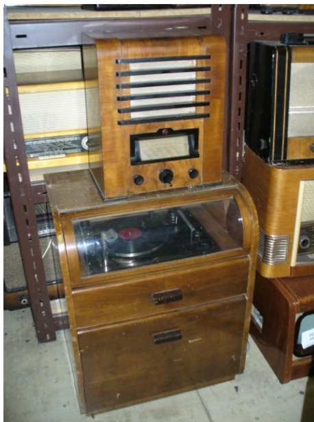
Obr. 22: Různé rozhlasové přijímače ze skladu fundusu ČT