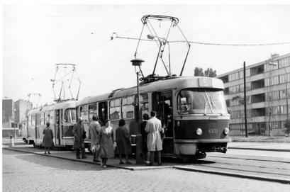
Obr. 6: Doprava v ČSSR za socialismu (Praha), fotograf neznámý

Autobusové terminály v dnešním smyslu slova neexistovaly, pouze ve větších městech byla autobusová nádraží s možností zakoupení jízdenky, běžně se však jízdenky kupovaly v autobuse.