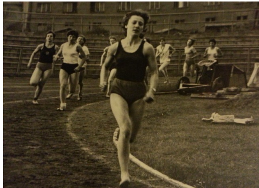
Obr. 24: 2. pamětník

Aktivně. Jak jsem již řekla, byla jsem v té době dost úspěšná a velká řada vítězství jak v oblastních, krajských tak i celorepublikových kolech mě motivovala k pokračování v aktivním sportování i na gymnáziu. Zaměřila jsem se na delší tratě a začala jsem se věnovat i košíkové a přespolnímu běhu. Díky výborným výsledkům ve šplhu jsem byla nominována i do těchto soutěží kde jsem taktéž bodovala. Na vrcholu své sportovní kariéry jsem se ocitla před rokem 1968 ve svých sedmnácti letech. Potom přišlo zranění a později