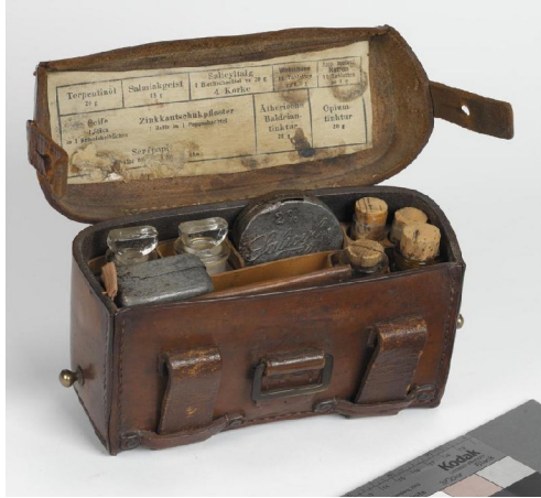
Obr. 26: Lékárnička z 2. světové války

U porodu asistovala porodní asistentka „porodní bába“. Porody byly velikým rizikem. Stav se hodně zlepšil díky dr. Semmelweisovi, který prosazoval, aby si lékaři umývali ruce.