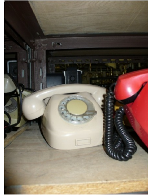
Obr. 11: Telefonní přístroj ze skladu fondusu České televize