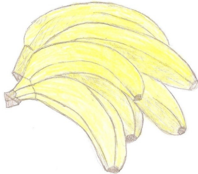
Obr. 3: Banány (kresba Mariana Drewsová)

Dnes je vše plné chemických látek, které zvyšují trvanlivost atd., to tehdy nebývalo a vše bylo čerstvé, i když ne vždy dostupné. Dnes je o mnoho snazší koupit banány než tehdy. Tehdy to byl nespílitelný sen. Dnes se i takovým exotickým ovocem plýtvá, jen proto, aby mohlo všechno být všude. Zbytečně. Dnes se vším plýtvá, tehdy si lidé vážili jídla o mnoho víc. Ale také nejedli tolik zdravě. Tedy, alespoň v rodinách mých respondentů. Jedlo se hodně smažené a také sladké. Dnes čím dál víc lidí sleduje, co je v jídle, které jedí, a zajímá se o to, jaké to na ně bude mít účinky, když budou jíst toto anebo tamto. To tehdy neexistovalo. Lidé zajímalo pouze to, zda jim chutná a jestli se najedí. O vegetariánech nemluvě. Pro ty nebylo nic. Všude bývalo samé maso, žádná možnost výběru jako dnes. Maximálně tak smažené sýry, to bylo pro ně vše, co mohli dostat. Ale dnes je doba dávno jiná a máme o mnoho větší výběr jídla i nápojů, a to jak těch alkoholických, tak nealkoholických. Ve všem je o hodně víc možností. Někteří lidé si to však neuvědomují.