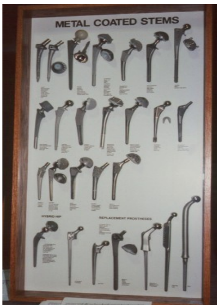
Obr. 27: Umělé klouby

Vylepšila se rychlost akutní léčby vývojem sanitky, kterou stačilo přivolat a ona ihned přijela, potom byl zajištěn rychlý transport pacienta přímo na sál. Taková pomoc zachránila mnoho životů.