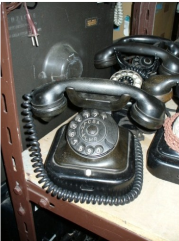
Obr. 12: Telefonní přístroj ze skladu fondusu České televize