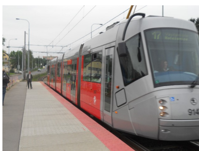
Obr. 7: Doprava v ČR v současnosti (Praha)