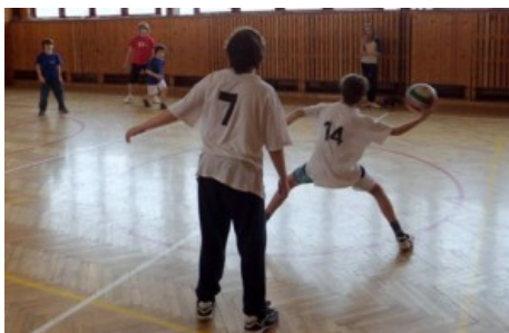
Obr. 35: Vybjíjená

Niektorí z nás chodili do hudobnej (ja som napr. chodila 4 roky na klavír, ale keď som začala tvrdiť, že ma to nebaví a nechcem chodiť, tak to rodičia akceptovali a odhlásili ma, skrátka nás do ničoho nenútili...). Prežívali sme nádherné, neopakovateľné detstvo. Na ulici sme sa hrávali do večera, doma sme museli byť, keď nebolo pouličné osvetlenie, keď sa začalo stmievať a neskôr, keď sa zažali pouličné lampy. Akceptovali sme to, a tak nám rodičia dôverovali. Vždy vedeli, kde sme a s kým sme, s nikým nám nezakazovali sa hrať a pritom sme tam bývali deti z učiteľských rodín, úradníckych rodín, z gazdovských rodín, rodičia niektorých detí boli remeselníci, ale všetko to boli slušní ľudia. Nepamätám si, že by sa niektorí rodičia navzájom hnevali, že by sa nezdravili, nikdy sa do nás detí nestarali, všetko sme si navzájom medzi sebou vybavovali sami bez ich zásahov, takže nemali sme ani my, ani rodičia z čoho byť nervózni, stresovaní, pohádaní, známky v škole rodičia nebrali nijako tragicky, povedali, že sa učíme pre seba a to bolo asi všetko. Nikdy sa nešli sťažovať kvôli známkam do školy, nikdy nebol na vine učí-