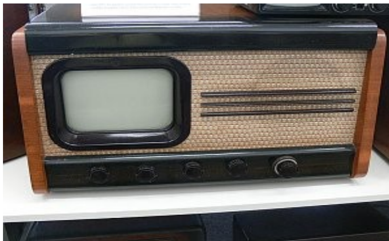
Obr. 18: Televizní přijímač Tesla 4001A