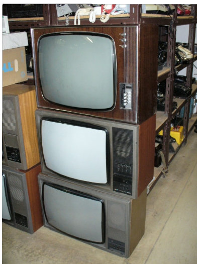
Obr. 16: Různé televizory z 70.–80.let 20. století ze skladu fundusu České televize