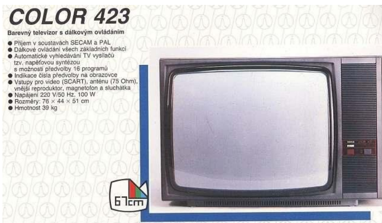
Obr. 19: Televizor Tesla Color 423, první československý barevný televizor s dálkovým ovladačem.