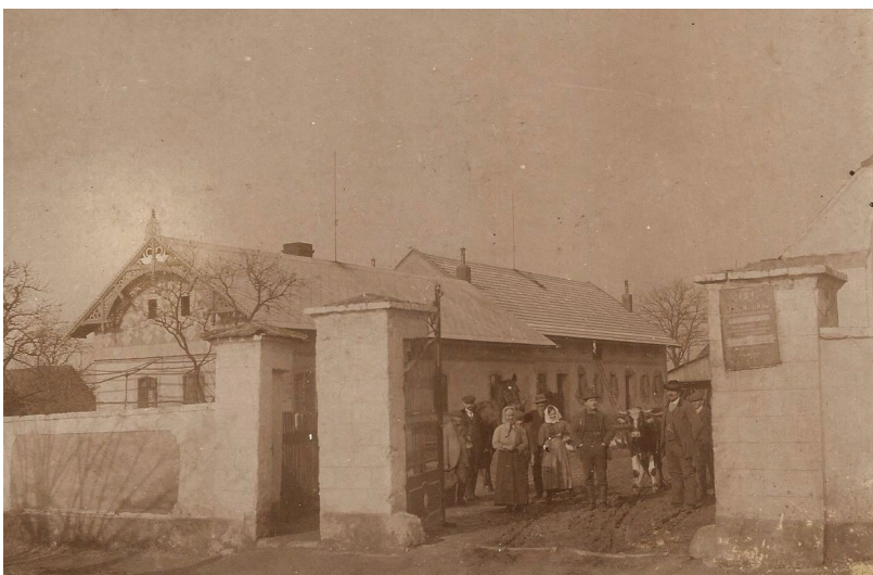
Obr. 36: Rodina Starých roku 1920

My jsme v té době bydleli na Podkarpatské Rusi. Jenomže nás potom vyhnali, museli jsme tam všechno nechat a museli jsme odjet. Nejdřív ženy a děti, to jsem měla ještě bratříčka, který potom zemřel ve třech letech, a když