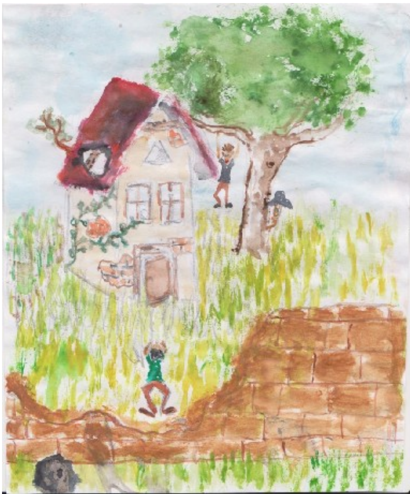
Obr. 32: „Dělali jsme tajemné výpravy do opuštěných domů.“ (kresba Magdalena Houžvičková)