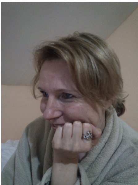
Obr. 28: Pamětník 1

S rodičema žádné nebyly, ale prarodiče mi to vynahradili.