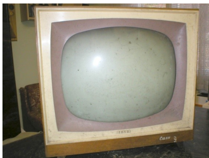
Obr. 14: Černobílý televizor Tesla Carmen