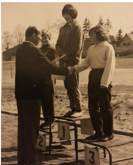
Obr. 25: 2. pamětník

jsem se ale snažila vést mládež ke sportu a naučit je alespoň základům jak atletiky, tak například právě sportovního potápění.