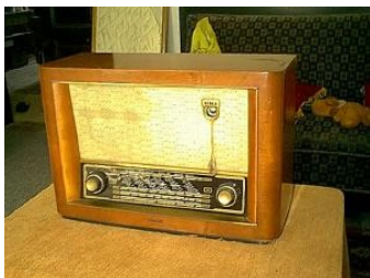
Obr. 21: Tesla 521A „Populár“, rok výroby 1956/57