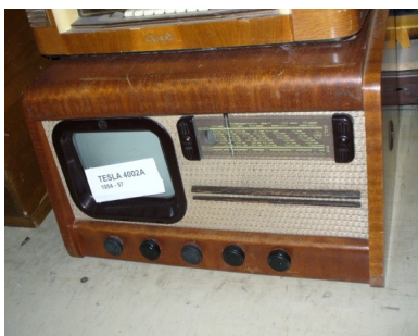
Obr. 15: Televizní přijímač Tesla 4002A