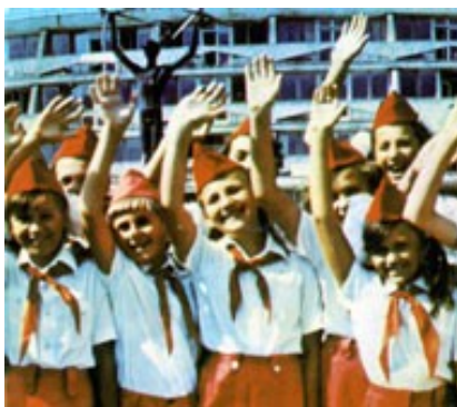
Obr. 34: Pionýři v Sovětském svazu. 70. léta

Je to těžké si na to vzpomenout. Ale jak ze školky, tak i ze školy mám ty nejlepší a nejteplejší vzpomínky. Víím jistě, že to bylo zajímavější, program byl zajímavější. Pamatuji si, jak jsme vždy měli různé slavnosti ve škole. Měli jsme Děda Mráze (na Ukrajině slaví No-